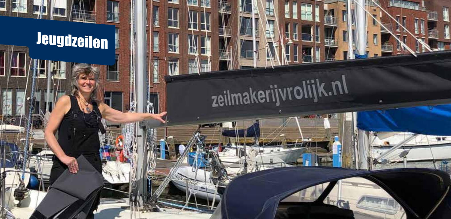
Zeilmakerij Vrolijk sponsort een nieuwe genua en grootzeilhuik! Waarvoor grote dank!