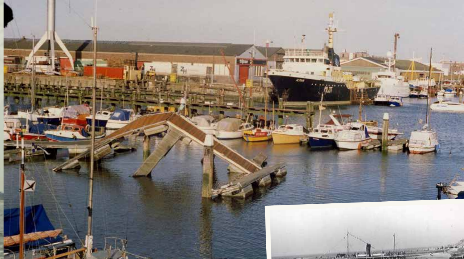
Palen te kort