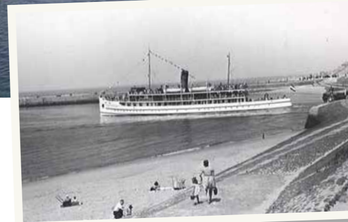
Salonschip Van Wijck omstreeks 1951