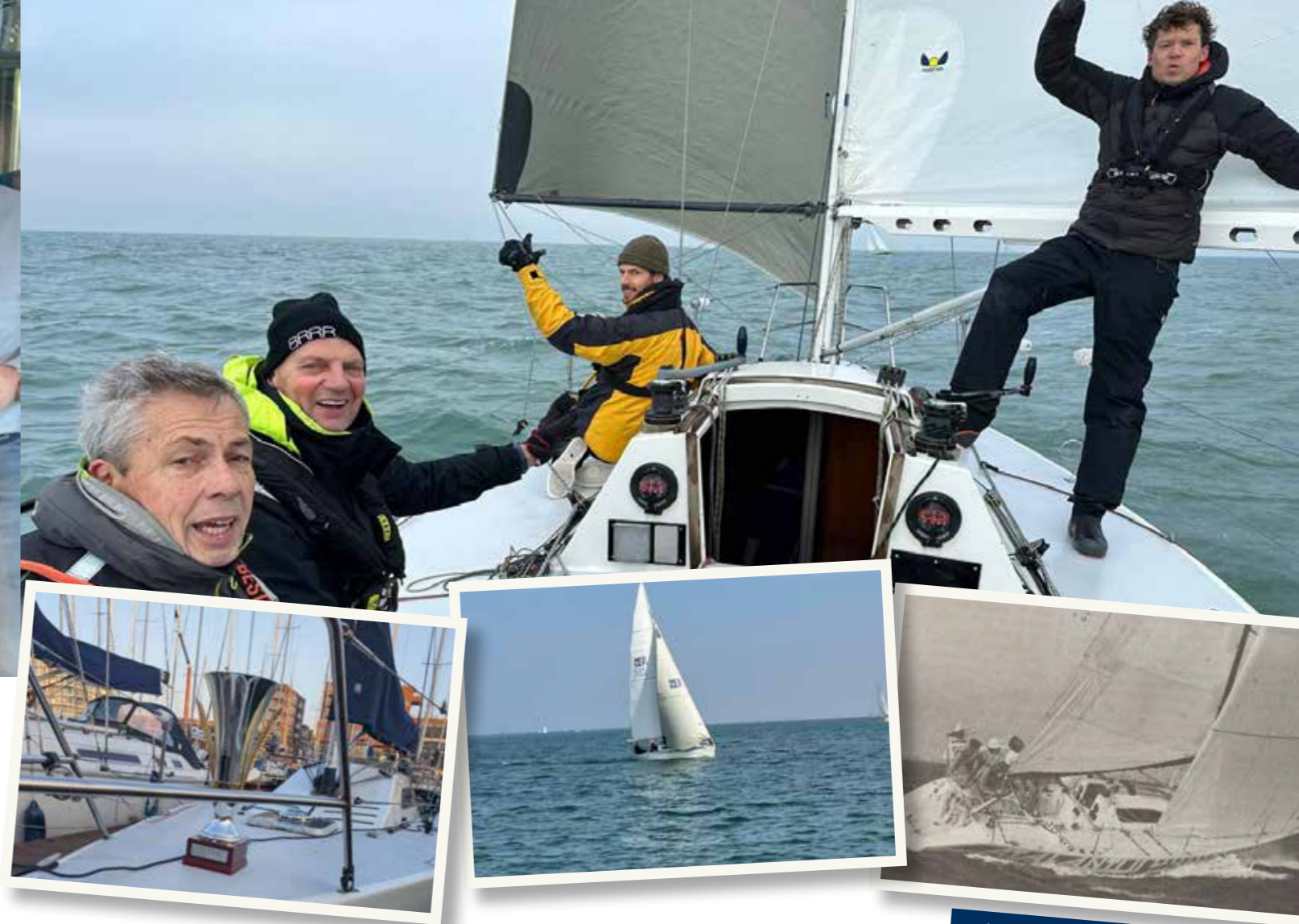
collegaschip Matchless Atalanti winnaar WK Halfton Cup 1982

Vooral met veel wind heeft dat een keer tot een bijna zwemervaring geleid, voor de eigenaar van het schip, omdat hij toen ineens